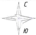
Схема планировочной организации земельного участка Разбивочный план М 1:500